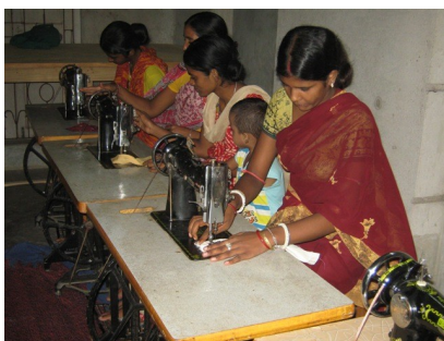
Projet 10/013 SMVS: Formation en couture pour le démarrage de micro-entreprises, Bengale-Ouest, Inde.

Au début de l'année nous avons considéré que puisque notre objectif était de traduire la solidarité des collègues des institutions européennes avec les pays du Sud, que nous devions aussi soutenir les organisations internes qui, comme le Schuman Trophy , partageaient nos buts. Nous avons ainsi développé une action de partenariat qui se traduit aujourd'hui par l'apport d'une contribution complémentaire à trois des projets que le Trophy a sélectionnés: pour la fourniture des pupitres pour une école au Bénin, l'électrification d'une école au Mali ainsi que la fourniture de mobilier scolaire en Uganda. Le montant que nous avons ainsi attribué s'élève à 8.905 €.