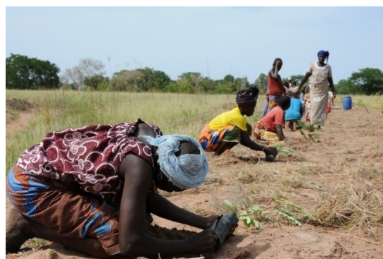
Projet 09/77 APFG – activités de reboisement dans la province de Poni, Burkina Faso

En 2010, une visite a été effectuée sur les lieux de réalisation d'un projet soutenu (09/04 Cogesten) à Lomé, au Togo, par un ami d'un membre du Comité.