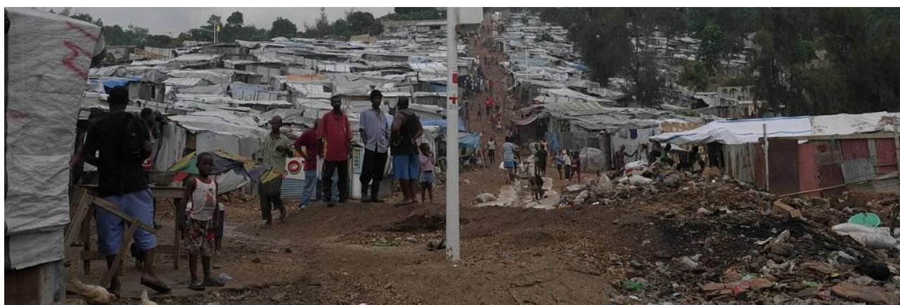
Projet 10/44 Electriciens Sans Frontières en Haïti: distribution de 450 lampes solaires.

L'action « Devenez Ambassadeurs d'ETM » n'a pas eu le succès espéré : très peu de collègues et membres ont répondu à l'appel d'afficher un poster en format A3 reproduisant le bilan des projets soutenus en 2009 sur la porte de leur bureau, en témoignage de leur engagement et soutien à notre but. Certains l'ont fait mais ils ne nous en ont pas informés.