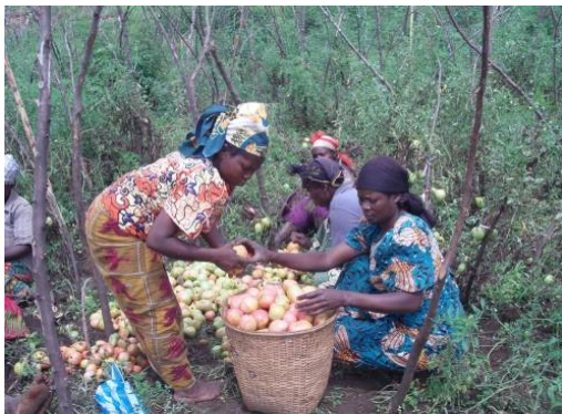
Projet 08/54 Solidarité Féminine – RDC

Amélioration du revenu de 150 femmes par la culture de la tomate, en territoire de Kabaré, sud-Kivu.