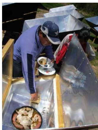
Projet 09/22 BISS - Argentine

Le montant moyen des engagements s'est élevé à 5.360 € par projet ( 7.040 € en 2009). Cette différence reflète une volonté de limiter le montant accordé par projet afin d'octroyer notre aide à un plus grand nombre de bénéficiaires.